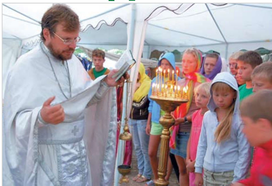
(Окончание. Начало на 1 стр.)

Корр.: Как Вы оцениваете современную молодежь?